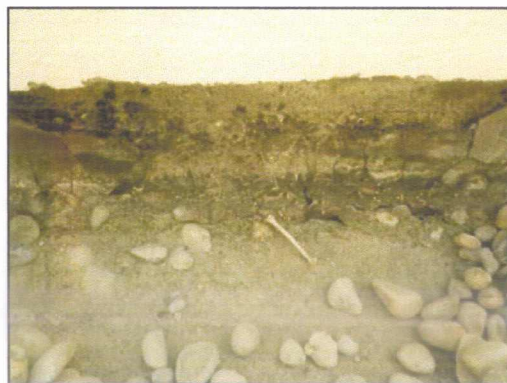
Visuels sur terrasse du 5°étage avec sable et graviers sur étanchéité ne contenant pas d'amiante.