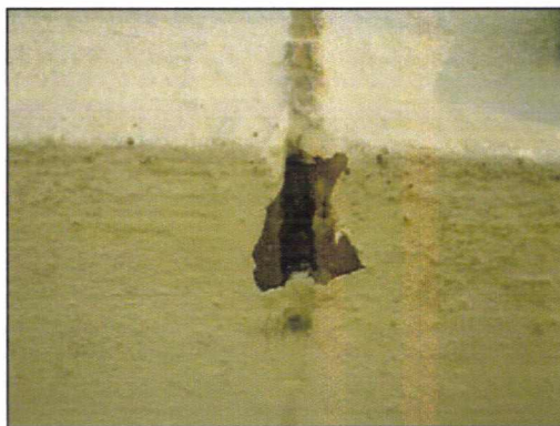
Visuel sur joint de dilatation ne contenant pas d'amiante