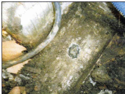
Visuels sur étanchéités des terrasses du 6° étage prélevées ne contenant pas d'amiante.